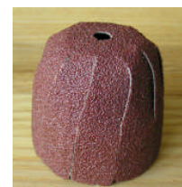
Slipbollen med rund topp.